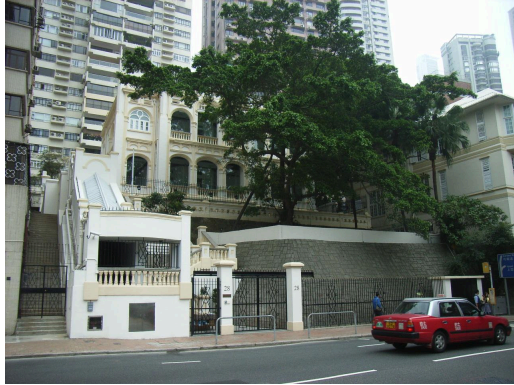
上下圖：左邊鐵閘門牌是28號的樓梯