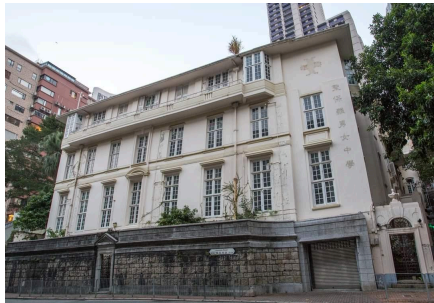
上圖：1999-2008 聖保羅男女小學校舍 2008-2013聖保羅中學校舍