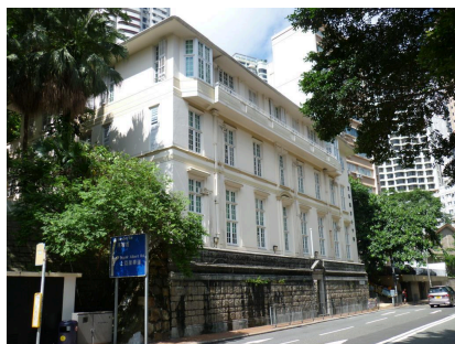
下圖：從此角度清楚看到石牆上的窄長露台長廊可供人站立