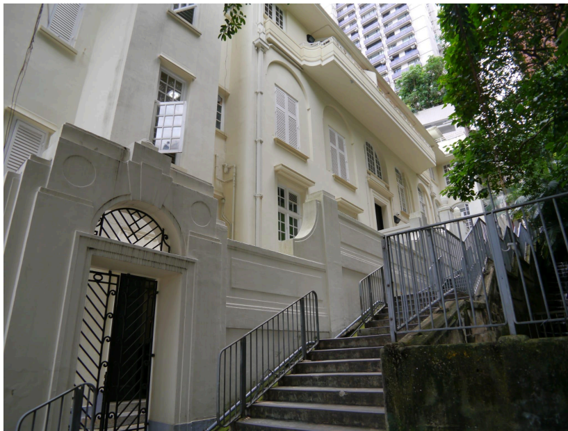
下圖：2022年八月