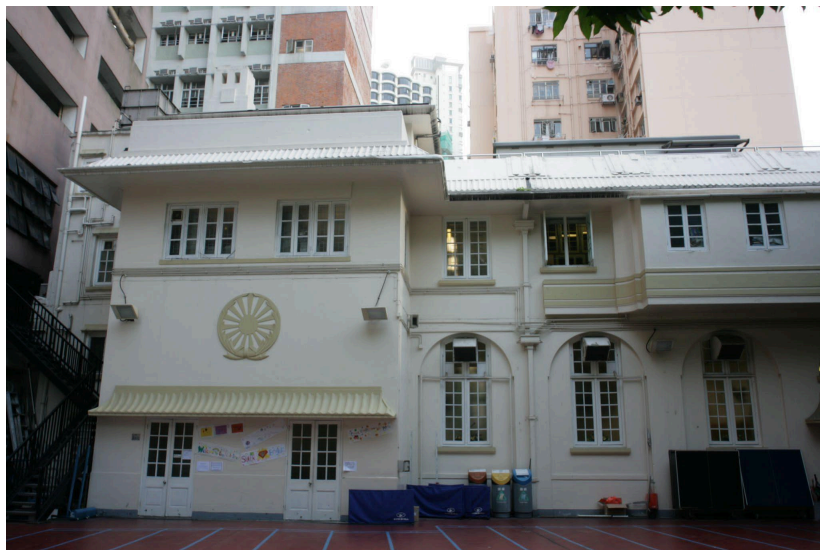
上圖: 日式紋章及石簷蓬 下六圖: 迴廊拱門滿溢厚重歷史感