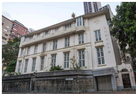
下圖：此角度看不到石牆上有窄長可站立觀街景的長廊(盆種植物已移走)